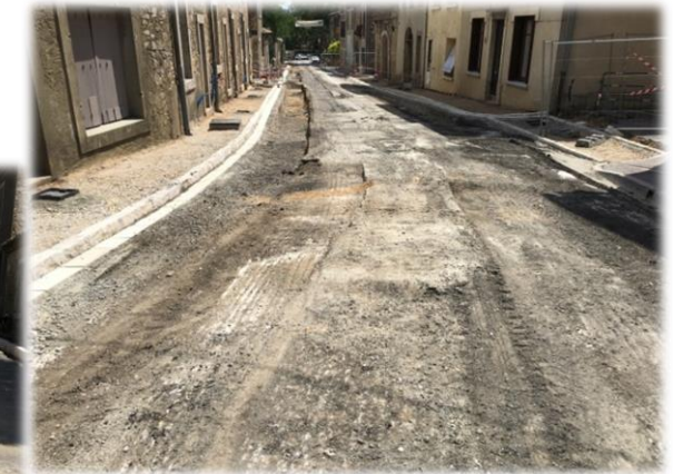
Reprise de la voirie