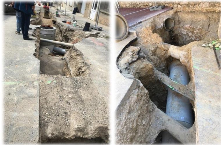
Création d'un réseau pluvial DN600 (haut de la rue de la mairie)