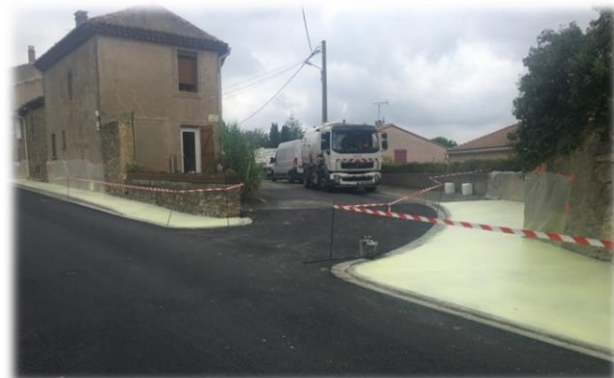
Béton désactivé sur trottoir en cours de réalisation