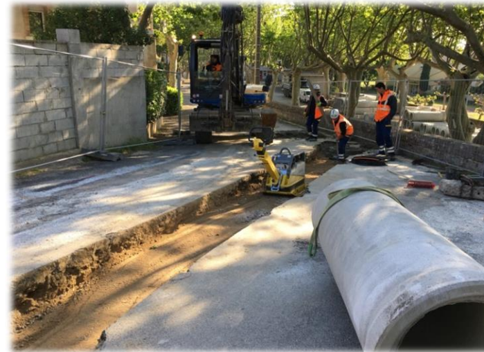
Création d'un réseau pluvial DN600 (bas de la rue de la mairie)