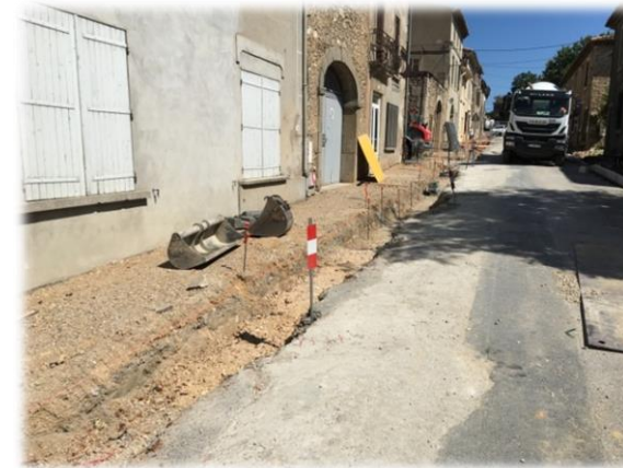
Création d'un trottoir accessible