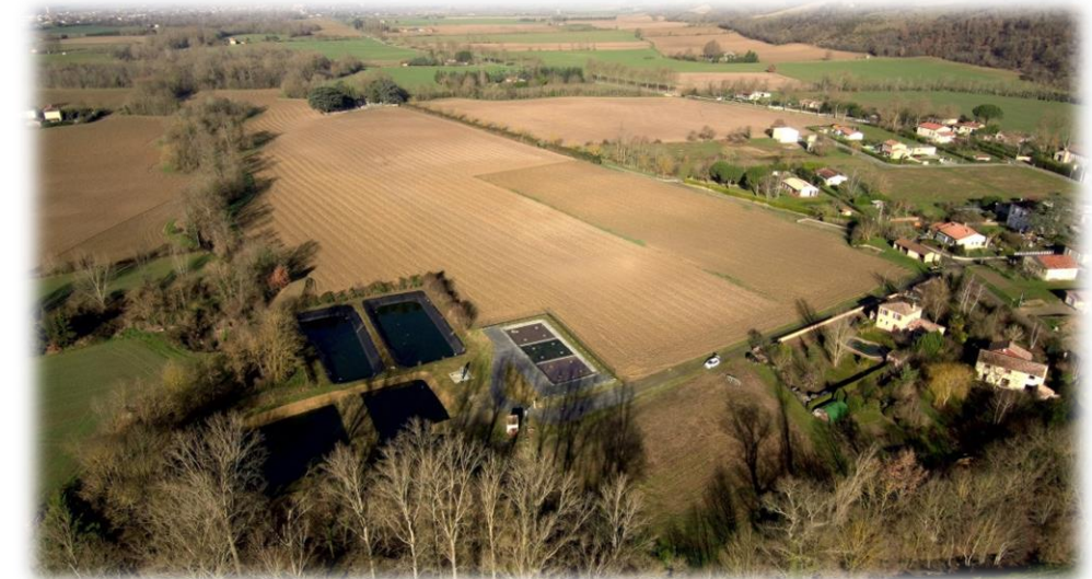
Lagune 1 existante