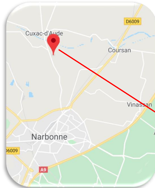
Carte de localisation des Travaux