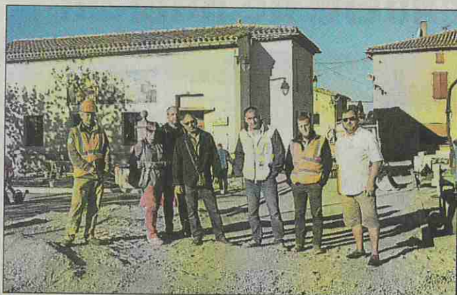
Les élus en compagnie des responsables de chantier.

Depuis la réunion publique de décembre 2017, bien des travaux ont été effectués pour la 1 re phase qui concerne le lieu-dit « place du Calcadis ». Après la mise aux normes des réseaux souterrains avec l'enfouissement des réseaux eaux usées et potables et du réseau sec, c'est le terrassement et la mise en place des margelles qui attirent toute l'attention de nos élus. Le futur auvent de 330 m 2 a été implanté. Il englobera la fontaine et permettra un abri aux marchands ambulants. Les