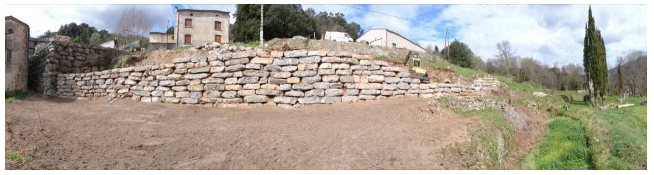
Photos Après travaux