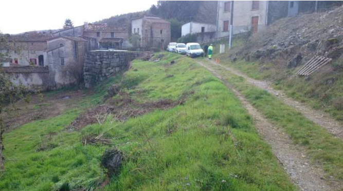
Photos Pendant travaux