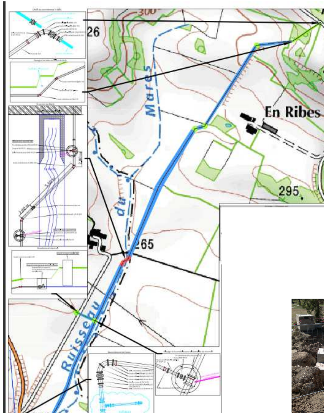
Carte de localisation des Travaux

Aujourd'hui ce renouvellement du réseau sur ce secteur permet de supprimer de nombreux risques de fuite et de rupture d'alimentation de tout le secteur aval du tronçon concerné.