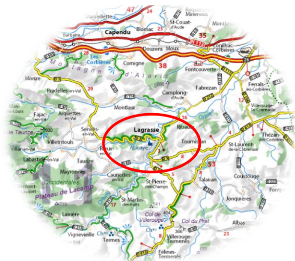
Carte de localisation des Travaux

Maître d'Ouvrage : Commune de Lagrasse (11)