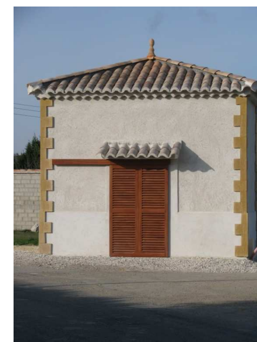
Photos Après Travaux