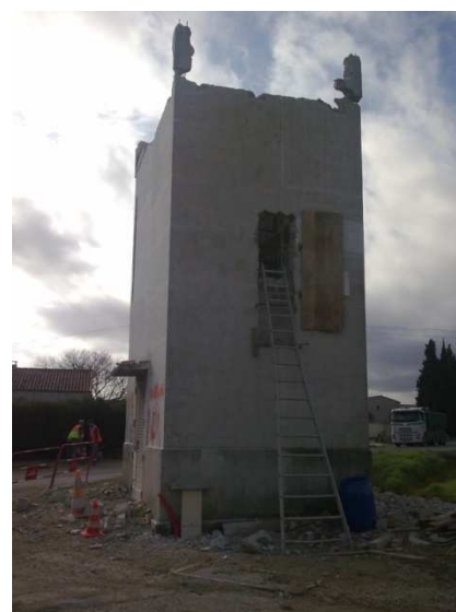
Photos Pendant Travaux