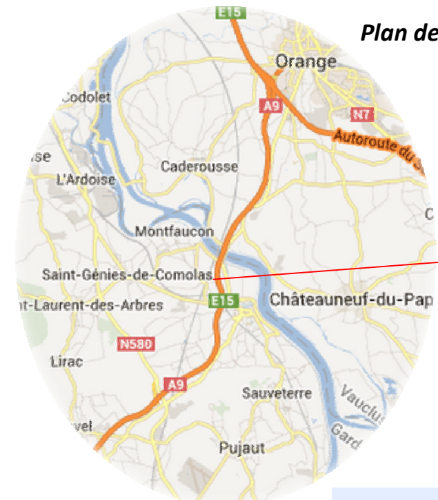
Plan de situation des travaux