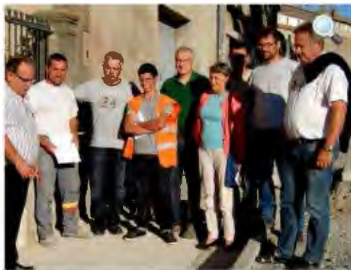
Les rues en chantier.

Demande de subventions : Un dossier de demande de financement pour les projets suivants a été déposé au conseil général. Rénovation de la piscine :