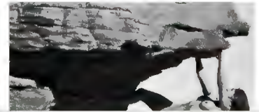
TOUS NOS DIAPORAMAS